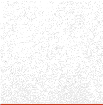
Sandila NRC perforada